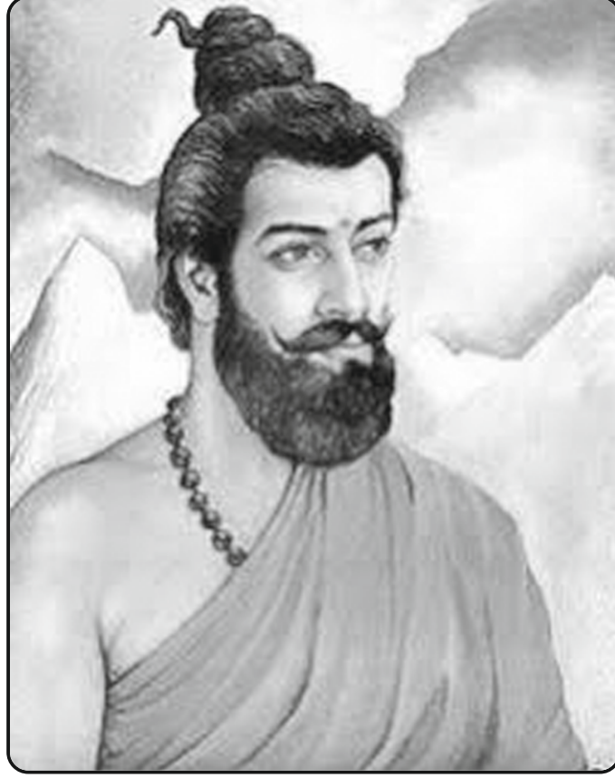
( श्रौतसूत्रकर्तुः महर्षि कात्यायन ऋषिः )

वेदपुरुषस्य अङ्गस्थानीय शास्त्राणां श्रौतसूत्राणां स्थानं महत्वपूर्णं वर्तते । प्राप्तश्रौतसूत्रेषु कात्यायनश्रौतसूत्रं महत्वपूर्णं वर्तते ।